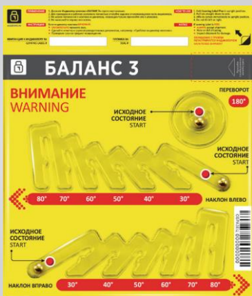
Индикатор в состоянии готовности